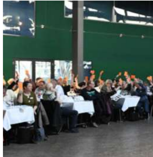
MBG + WG Gartenland (2021) EBG + WG Pestalozzi (2024)