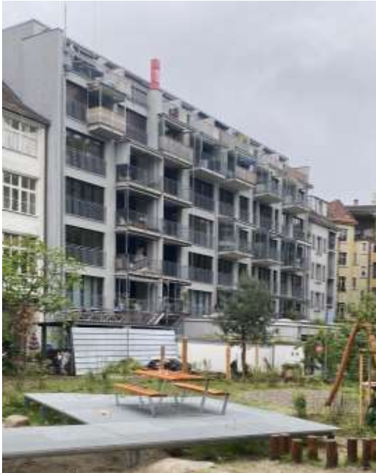
Wohnstadt + WG Elsässerstrasse 131 (2023)