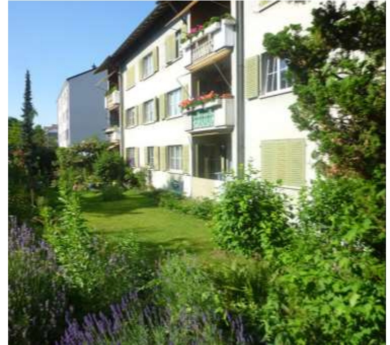
2015: Gewona + BG Nordwest neuer Name: GEWONA NORD-WEST 2020: WG Sowobin + Kleinhüningen 2023: WG Rote Leu + Ebenfeld 2024: WG Bottmingen + Neumatten